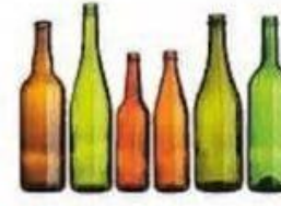
Стекло 1000 лет