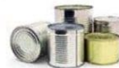
Жестяные банки 10 лет