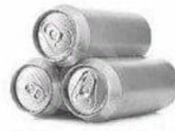
Алюминиевые банки 500 лет