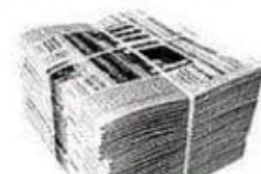
Газеты 1-4 месяца