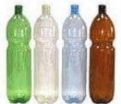
Пластик 180-200 лет