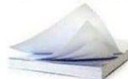
Офисная бумага 2 года