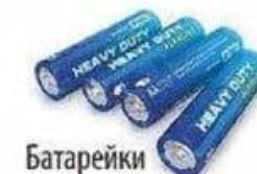
Батарейки 110 лет