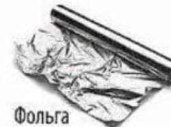
Фольга 100 лет